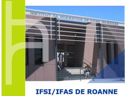
IFSI/IFAS DE ROANNE

« Obtenir son diplôme d'état d'aide-soignant par la VAE »